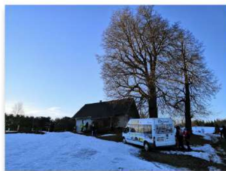
Náš bezbariérový vůz na cestách