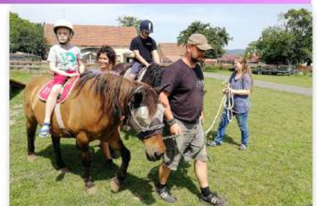
Hipoterapie v ekocentru Zvířecí pohoda