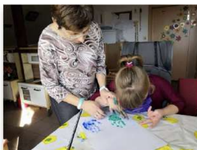
Asistence ve škole