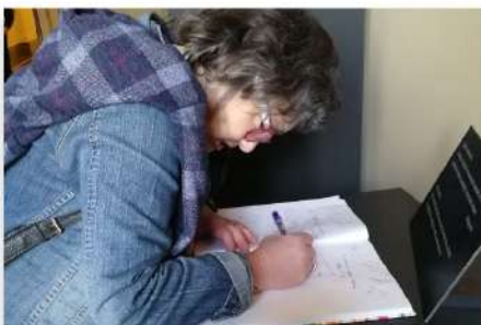
Výlet do Národního muzea