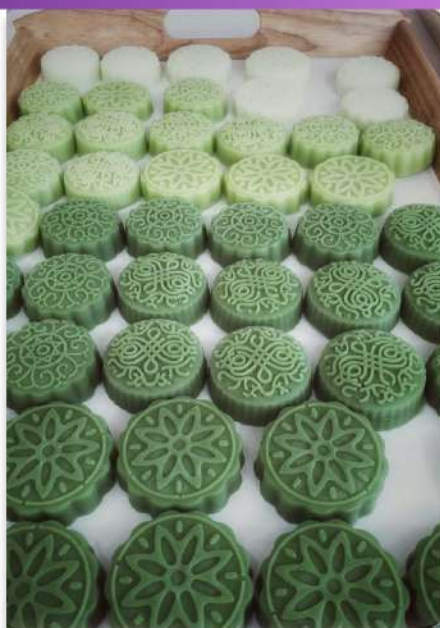
Mýdla s vůní eukalyptu a aloe vera