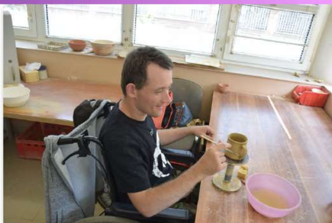
Aktivační činnost na pobytové akci