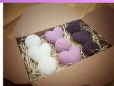
Mýdla v dárkové krabičce