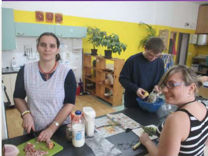
Nácvik běžných činností při vaření