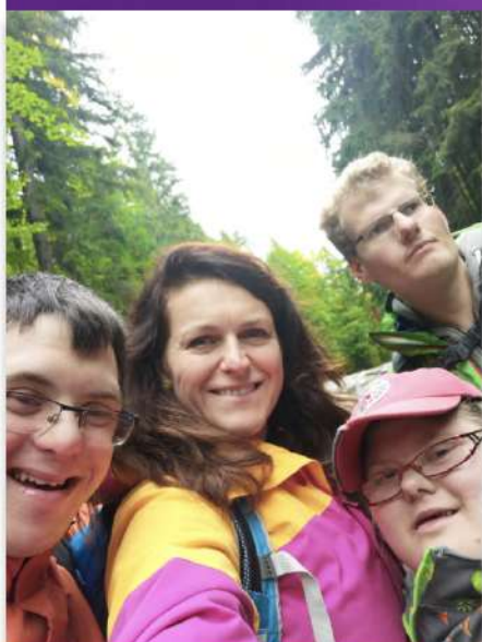
Procházka k Mumlavským vodopádům