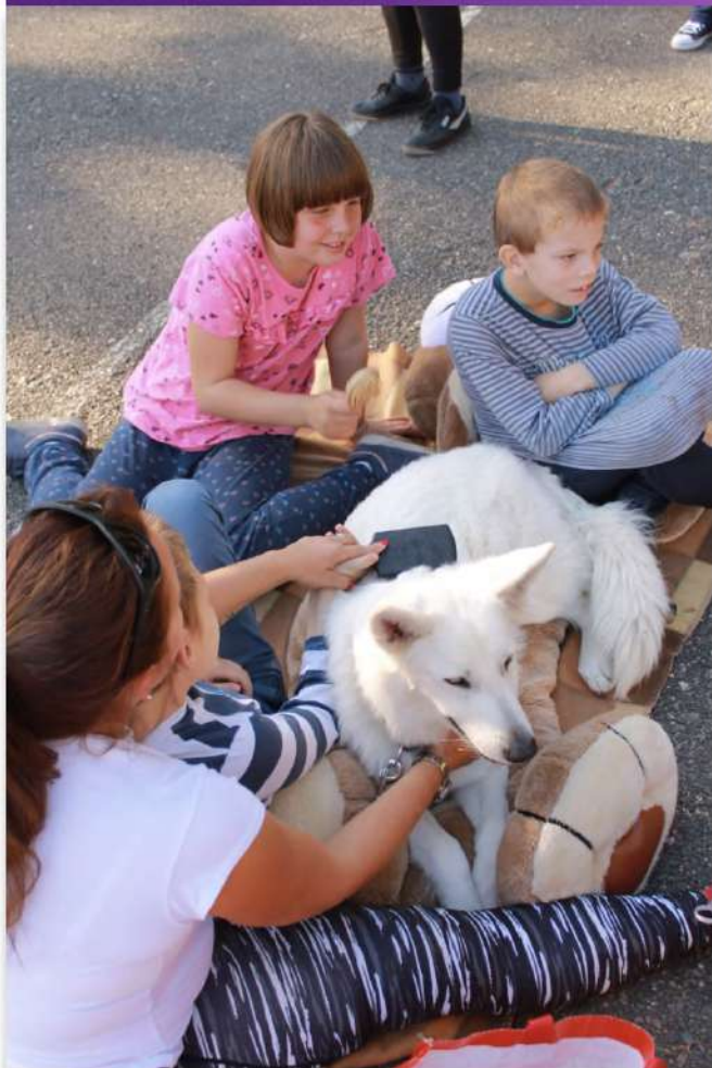
Relaxace na canisterapeutickém pobytu