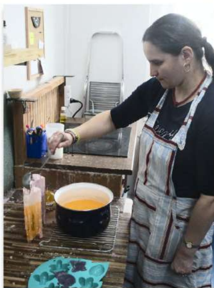
Nácvik pracovních činností