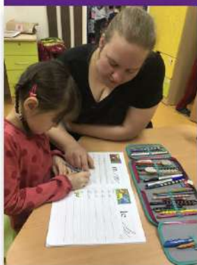
Pomoc s učením