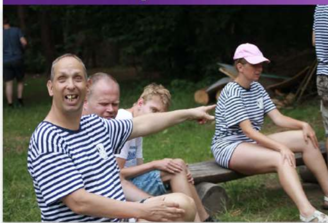
Letní pobyt na Úhlavce