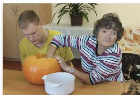
Dlabání dýně na Halloween