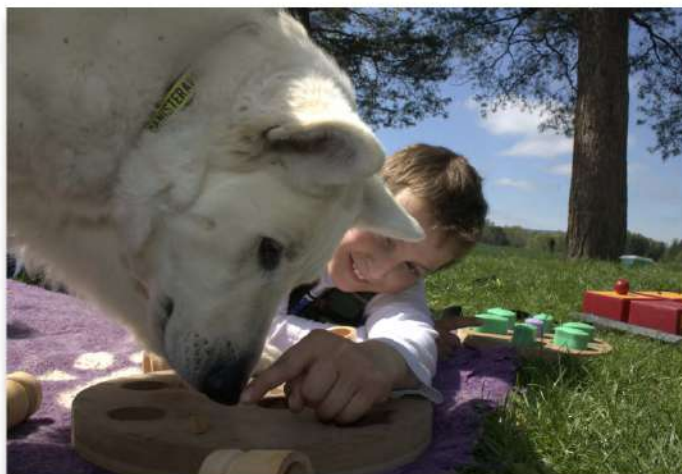
Pes přítel člověka