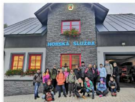
Návštěva horské služby v Harrachově