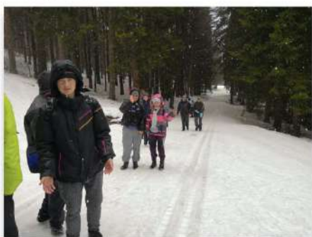
Výlet z Borové Lady na Lipku