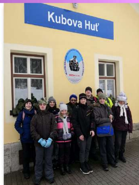
Zimní pobyt na Šumavě