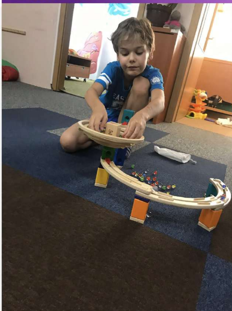
Zkouška nové kuličkové dráhy