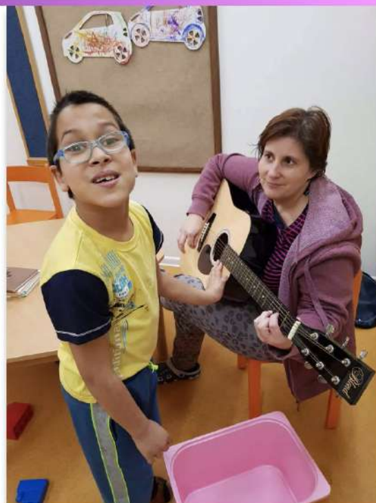
Asistence v dětském domově speciálním v Berouně