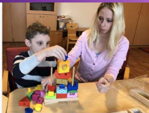
Asistence ve škole