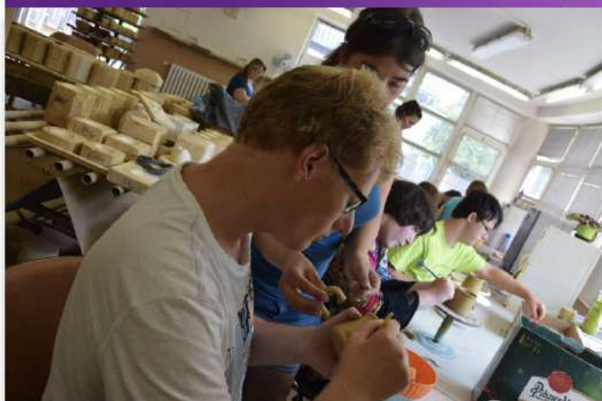
Aktivační činnost na pobytu v Exodusu