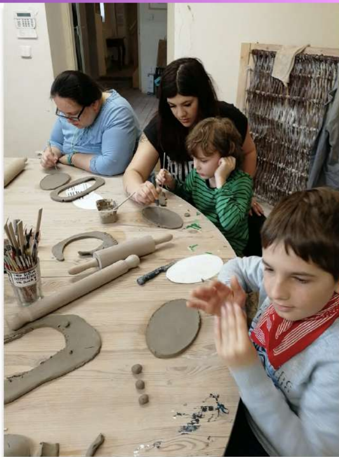
Návštěva berounského muzea keramiky